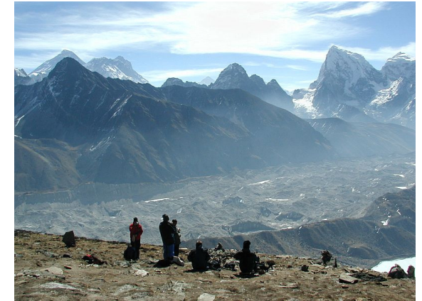
Im Aufstieg zum Gokyo Peak (5483 m) mit Blick auf den Nyimagawa-Gletscher