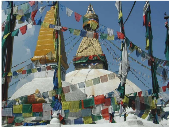
Der Tempel Swayambhunath in Kathmandu