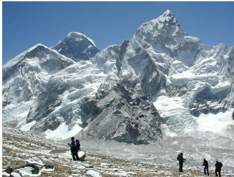
Mt. Everest und Nuptse vom Aussichts-5000ers "par excellence" Kala Patar (5545 m) aus gesehen