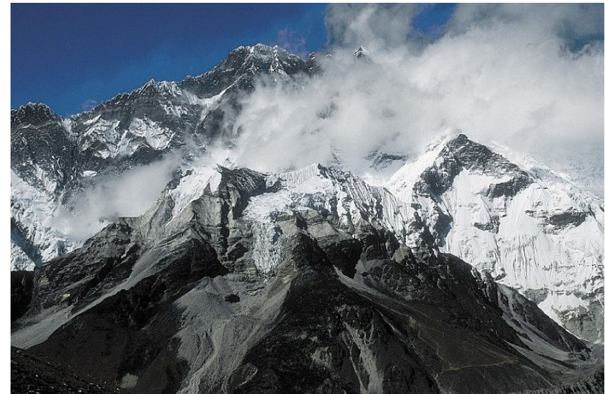
Der Island Peak (6189 m) mit der üblichen Aufstiegsroute vor der gewaltigen Lhotse-Südwand