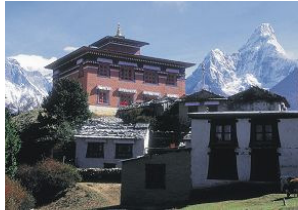
Am Kloster Tengpoche. Links Everest (8848 m) und Lhotse (8516 m) mit Schneefahne, rechts Ama Dablam (6856 m)